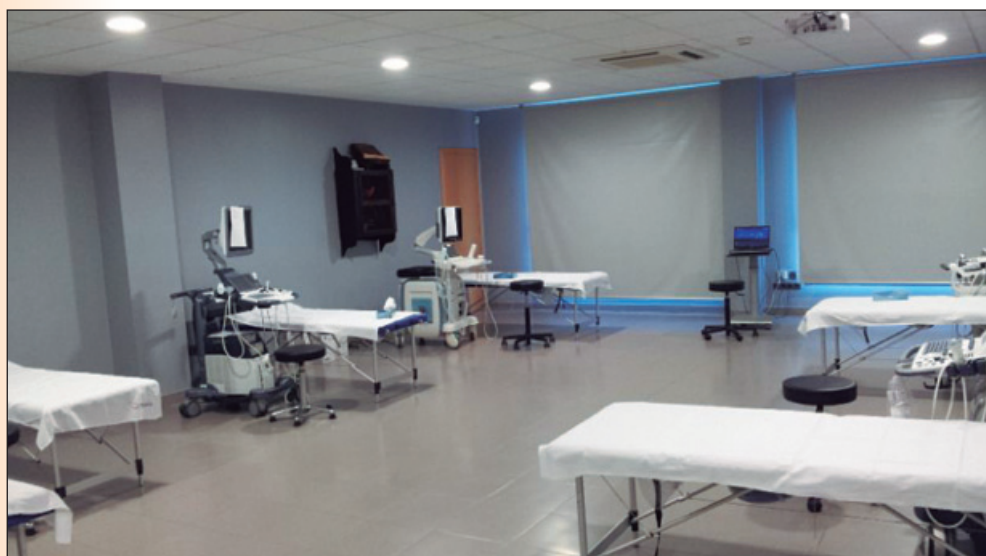
Sala de prácticas.