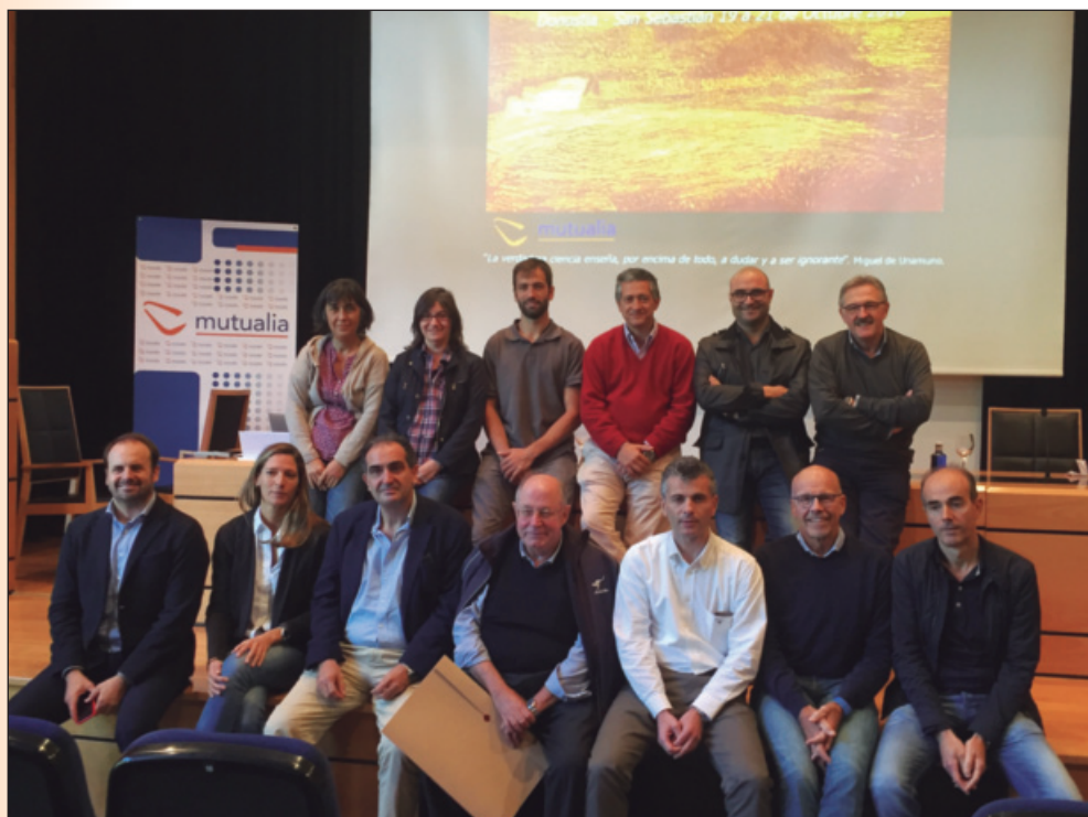
Profesorado del VIII Curso de Ecografía Musculo-esquelética (2016).